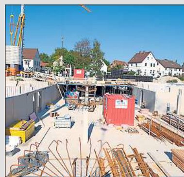
400 Tonnen Stahl werden auf dem gesamten Areal verbaut.

Die barrierefreien Wohnungen verfügen über 2 bis 4 Zimmer und 68 bis 113 Quadratmeter. Die Häuser sind nach dem KfW-70-Standard errichtet. Die Kaltmieten der Wohnungen betragen 8,50 bis 9 Euro je Quadratmeter. Für die Penthäuser rechnet Christian Vorderbrüggen mit rund 10 Euro. Weitere Informationen sind bei der Vorderbrüggen Bau GmbH unter ☎ 05244/93100 erhältlich.