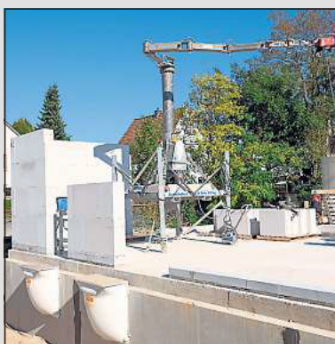
Die ersten Steine für die Wohnhäuser sind bereits gesetzt.