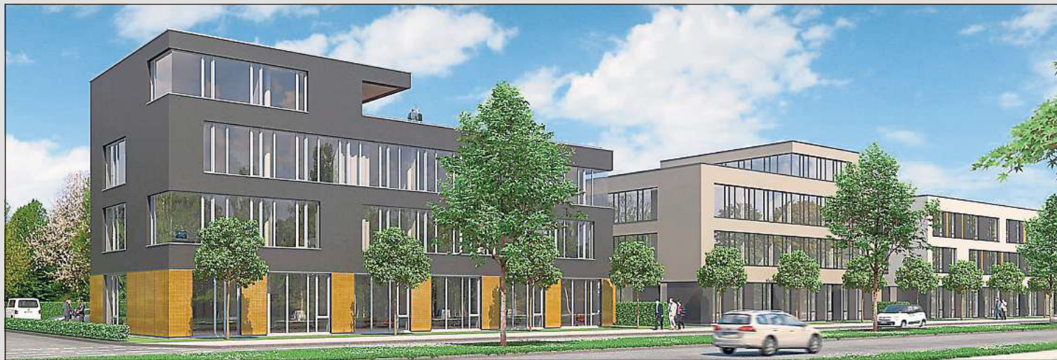
Gesamtansicht von der Verler Straße aus: Ende Mai 2016 soll das mittlere Gebäude fertiggestellt sein. Die beiden äußeren sind bereits bezogen. Auf der Rückseite entstehen fünf Achtfamilienhäuser, die im November 2016 bezugsfertig sind.