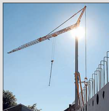
Der Blick aus der Tiefgarage. Bald kommt die Decke darauf.